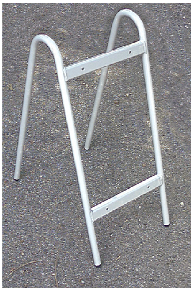
Cavalletto di sostegno