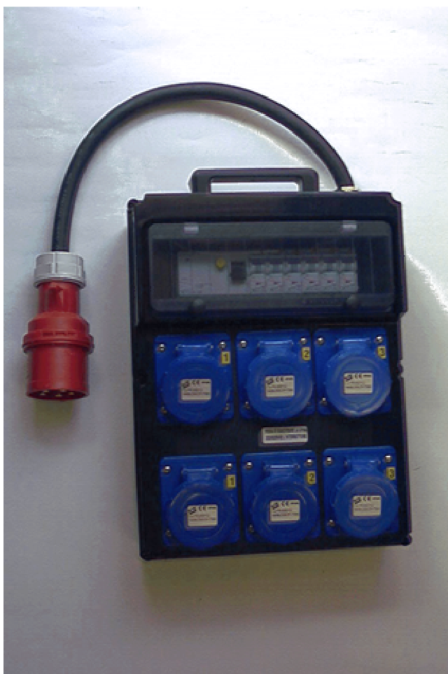
Esempio di quadretto