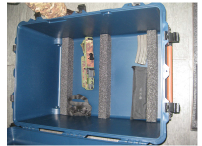
spazio sottostante i cassetti