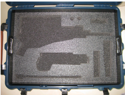
esempio del cassetto

Cases PA66 3 ARX160 completi accessori in 3 vassoi sovrapposti arma completa di ottica. Case mod 179L caratteristiche da seguente scheda tecnica, complete di n° 3 vassoi interni in metallo con maniglie, immagini indicative, in due cassetti saranno sistemati 4 ARX 160 calciolo ripiegato ( 2 per cassetto) nel terzo cassetto saranno sistemate le 4 pistole Beretta FS92 e le 4 canne di riserva degli ARX160,